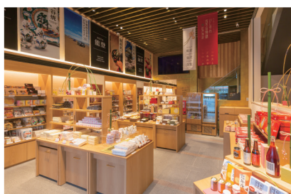
「いしかわ百万石物語 江戸本店」